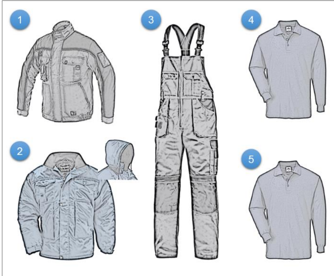
სურათი 1: საწარმოო პერსონალის ზამთრის სპეცტანსაცმლის კომპლექტი:

(1) ქურთუკი; (2) დათბუნებული კაპიუშონიანი წყალგაუმტარი ქურთუკი; (3) კომბინეზონი; (4)(5) გრძელსახელიანი მაისური;